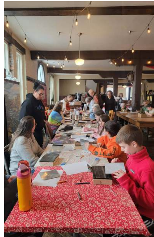
Imagen: Taller #2.

CALT Folk and Traditional Arts Experiences: Taller de Punched Tin a cargo de Folk Flair en The iNFAMOUS Art Collective, Buckhannon, WV