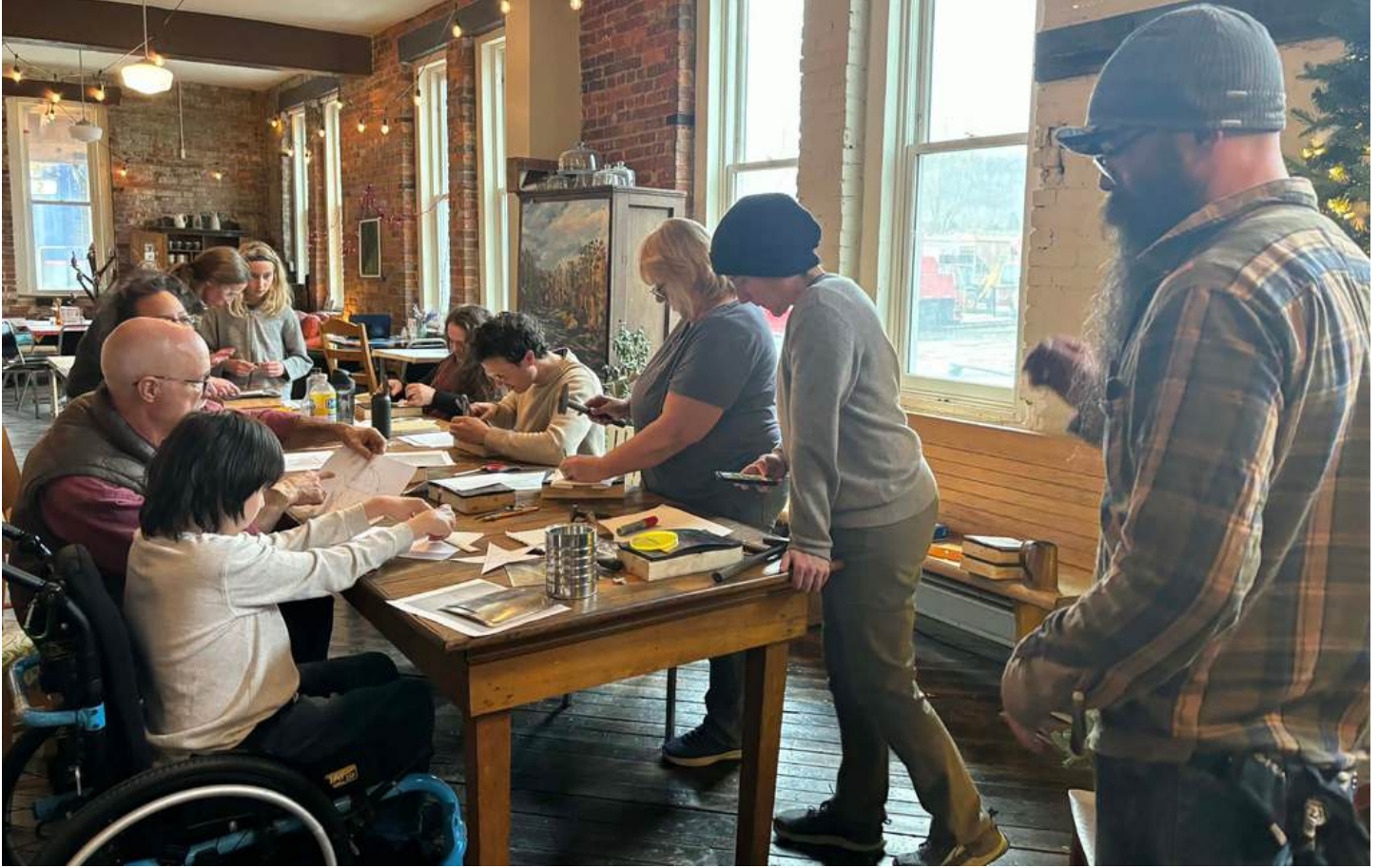
Imagen: Taller de hojalata repujada a cargo de Folk Flair en The iNFAMOUS Art Collective.