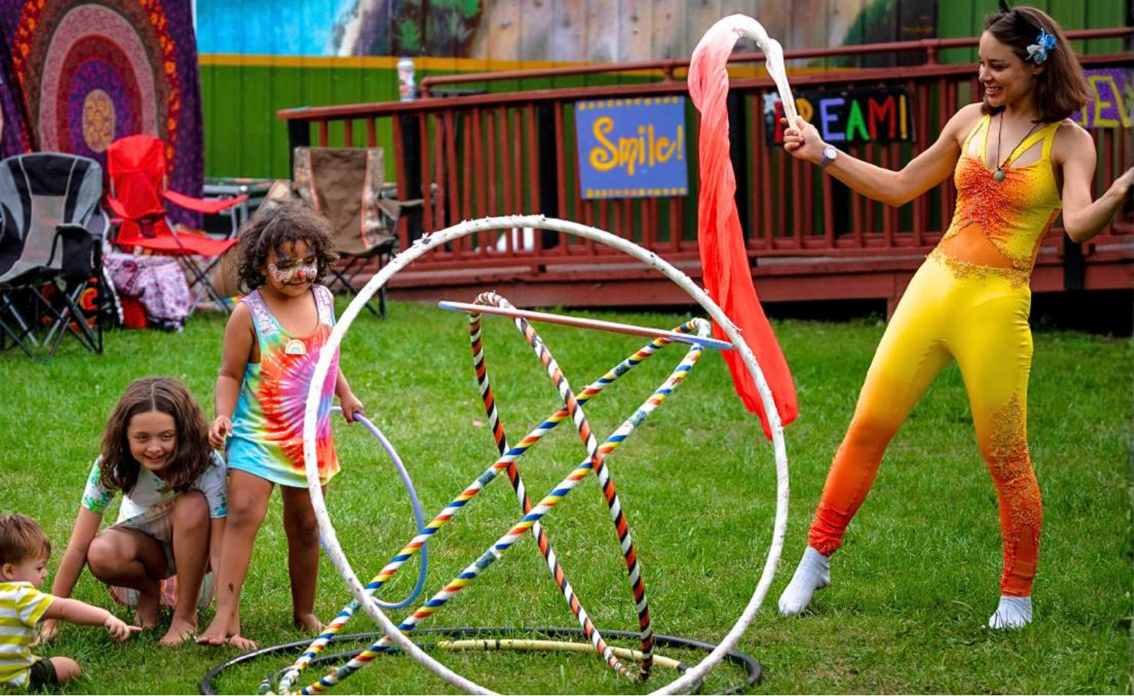
Imagen: Jóvenes participantes disfrutaron de un taller de movimiento flow a cargo de Fluidity Performance Troupe durante el 21 Culturefest World Music & Arts Festival en The Grassroots del Distrito de Princeton, WV.