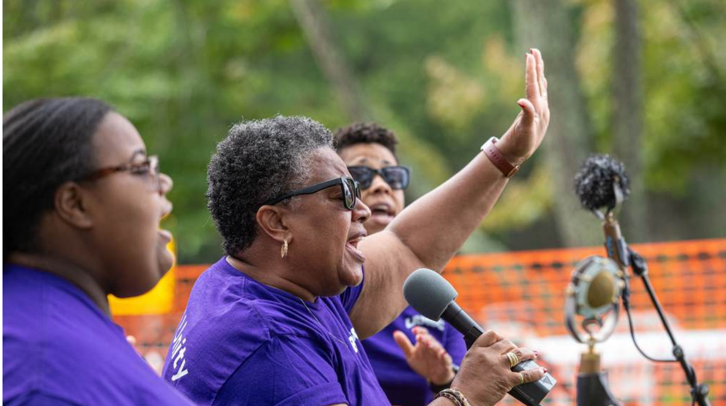
Imagen: El coro de The Little River Missionary Baptist Church dando un concierto en el Outdoor Stage del Floyd Living Traditions Festival.