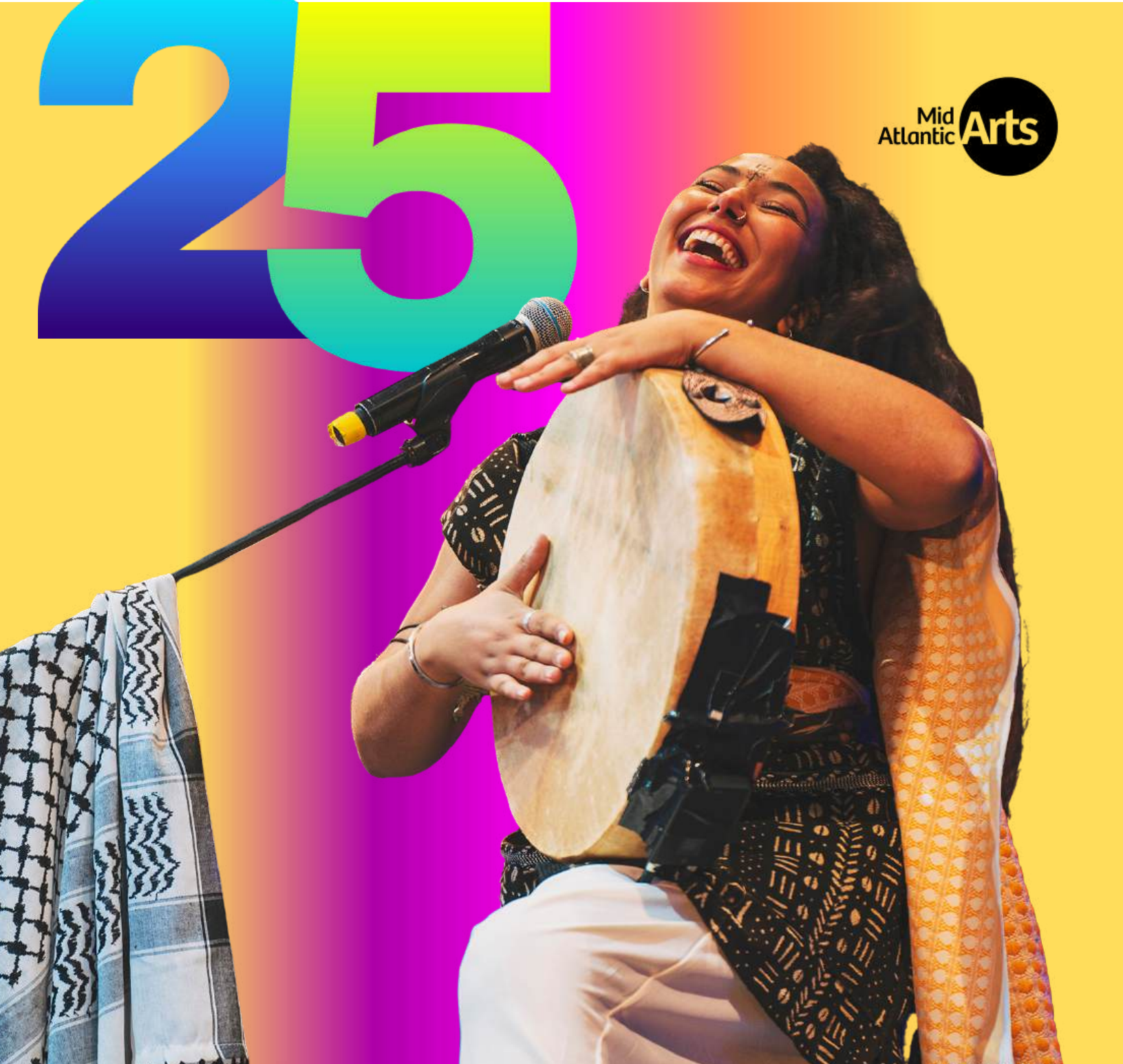
Imagen: Actuación de The Leila en The Virginia Arts Festival.