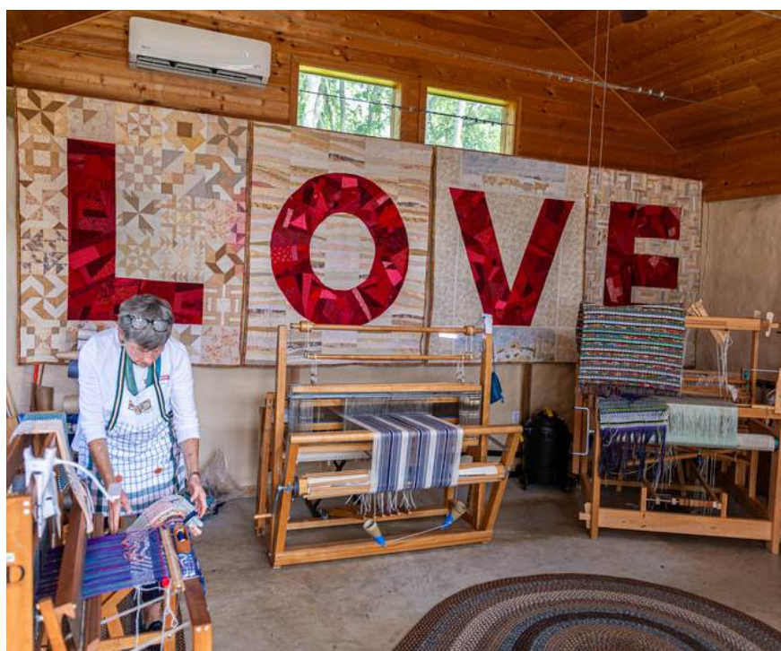
Imagen: Demostración de telar en el nuevo Loom Barn en el Floyd Center for the Arts. El quilt exhibido al fondo, The Virginia is for Lover "LOVE" fue donado por Floyd Quilt Guild.

"Estamos orgullosos de realzar las historias, canciones y experiencias transmitidas de generación en generación y de honrar voces legendarias como Randall Hylton junto con nuestra vibrante comunidad local".