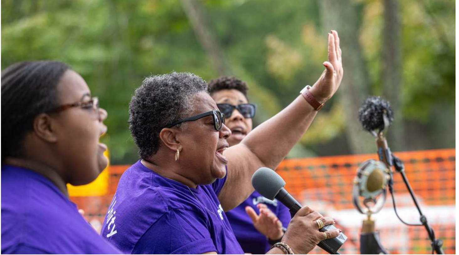
Imagen: El coro de The Little River Missionary Baptist Church dando un concierto en el Outdoor Stage del Floyd Living Traditions Festival.