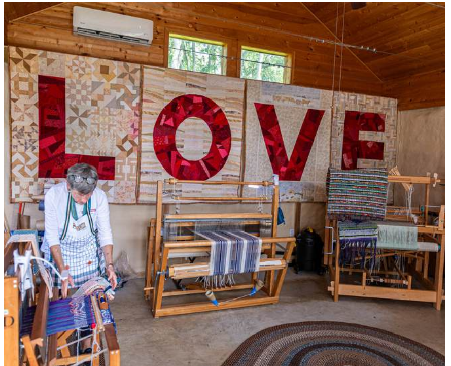
Imagen: Demostración de telar en el nuevo Loom Barn en el Floyd Center for the Arts. El quilt exhibido al fondo, The Virginia is for Lover "LOVE" fue donado por Floyd Quilt Guild.