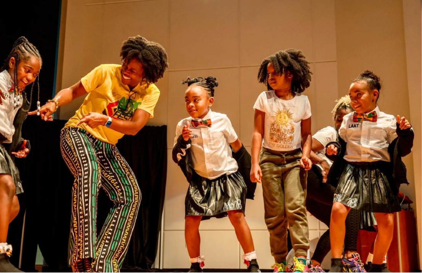
Imagen: Tidewater African Cultural Alliance. Crédito: Cortesía de Tidewater African Cultural Alliance.