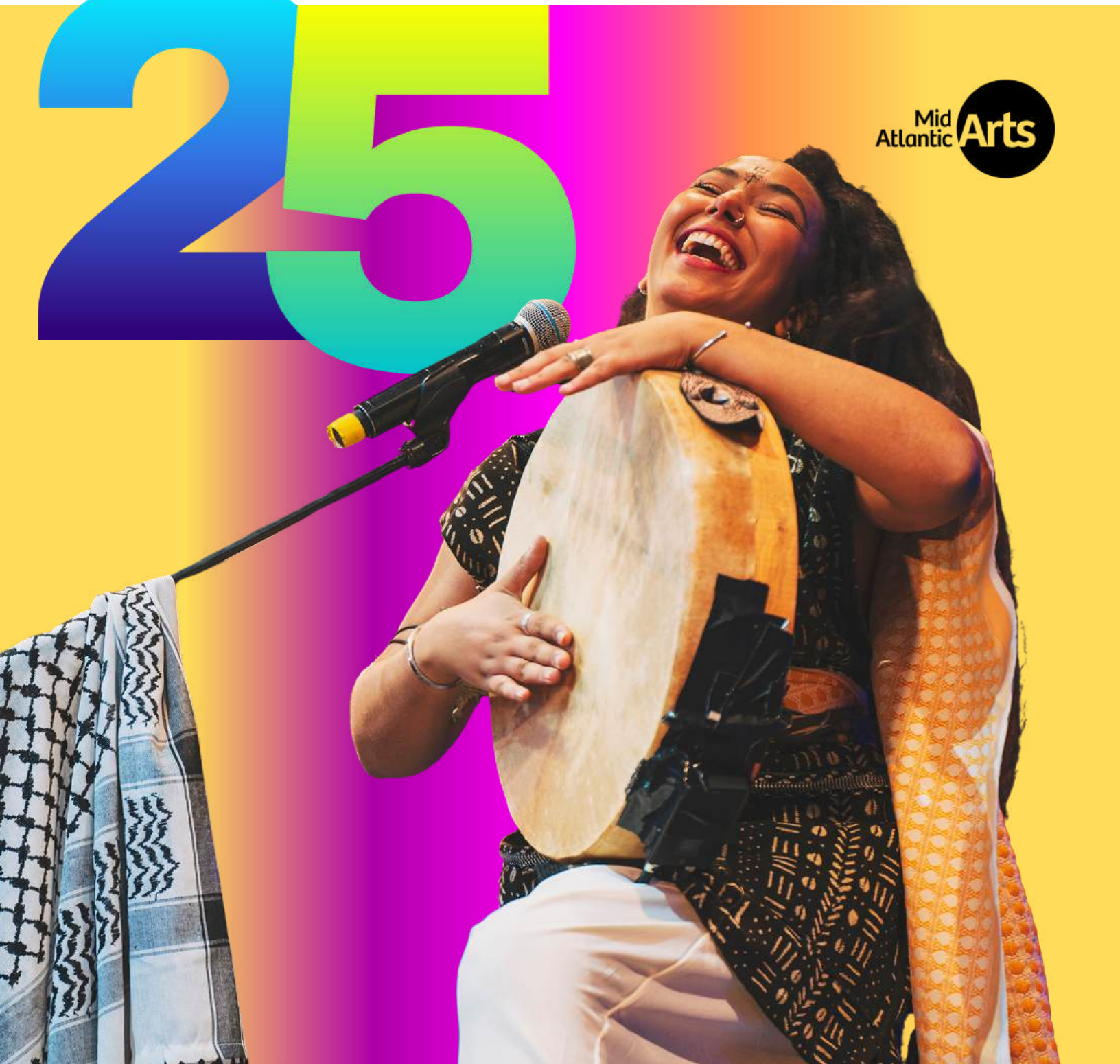
Imagen: Actuación de The Leila en The Virginia Arts Festival.