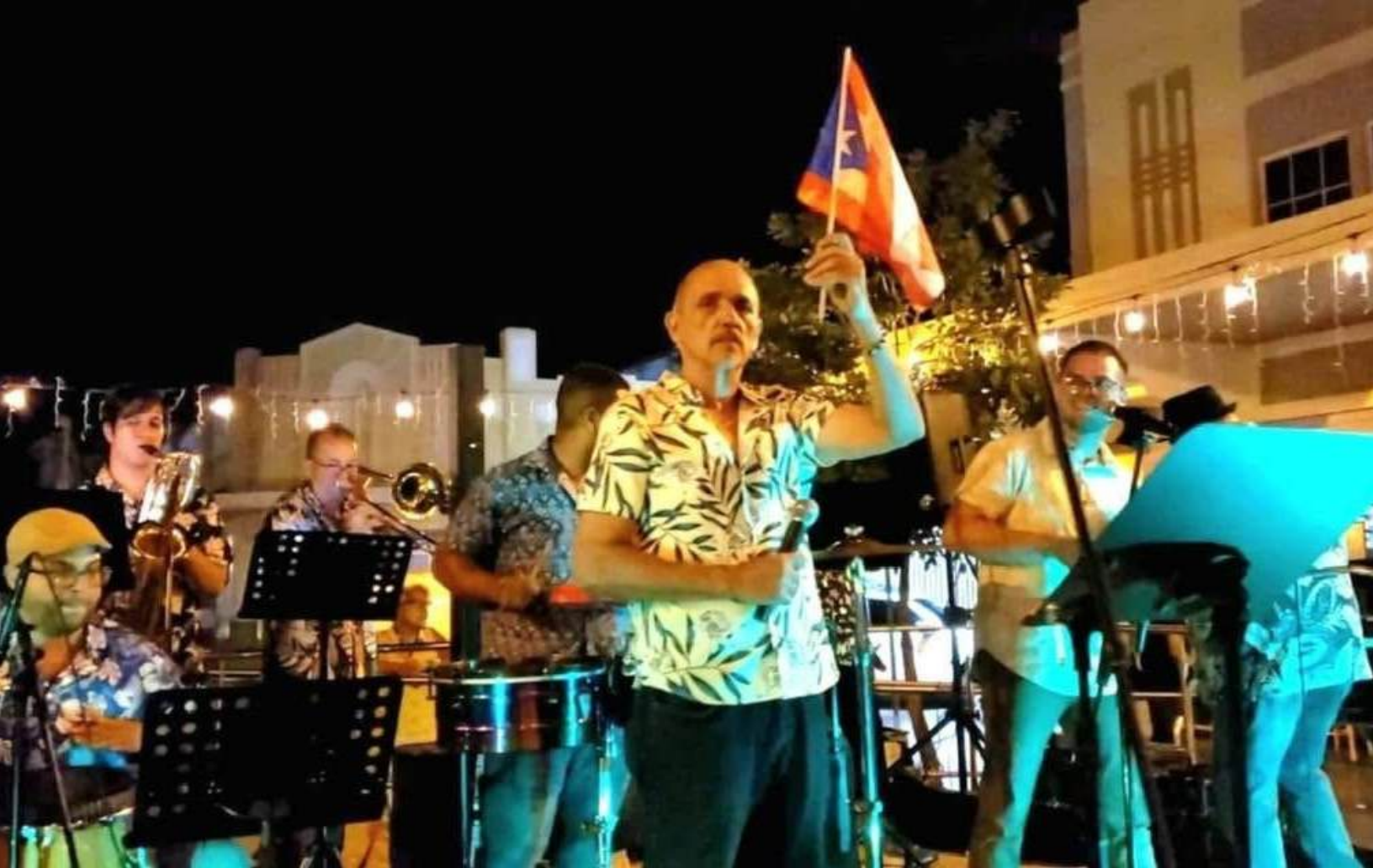
Imagen: Pleneros del Barrio en concierto en la Feria de Los Hijos de Bélgica en Ponce, Puerto Rico.