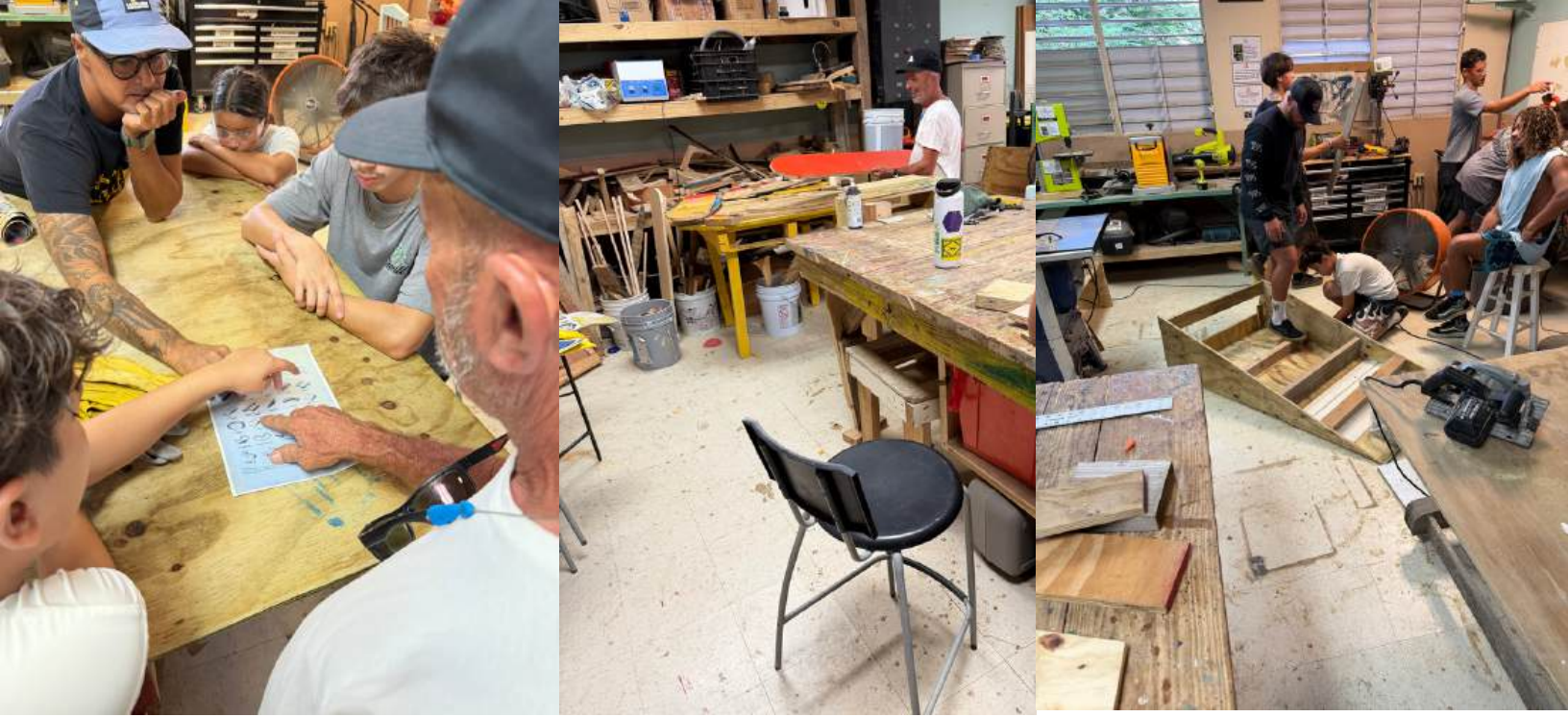
Imagen: Tres generaciones juntas trabajando para construir patinetas y rampas para skateboarding en el taller de carpintería.