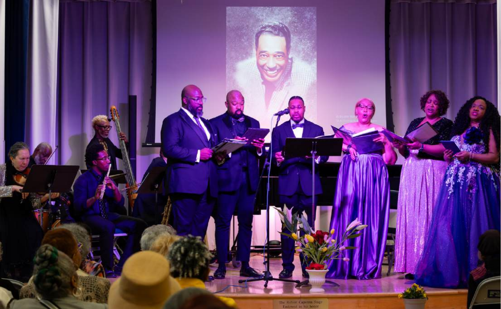
Imagen: Blue Note, un concierto de jazz presentado por The Marian Anderson Museum and Historical Society (Philly Jazz Month).