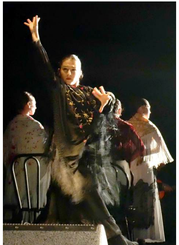
Imagen: Searching for Goya a cargo de Soledad Barrio & Noche Flamenca en Mount Gretna Playhouse.

Mid Atlantic Tours: Soledad Barrio & Noche Flamenca, Gretna Music , Lititz, PA.