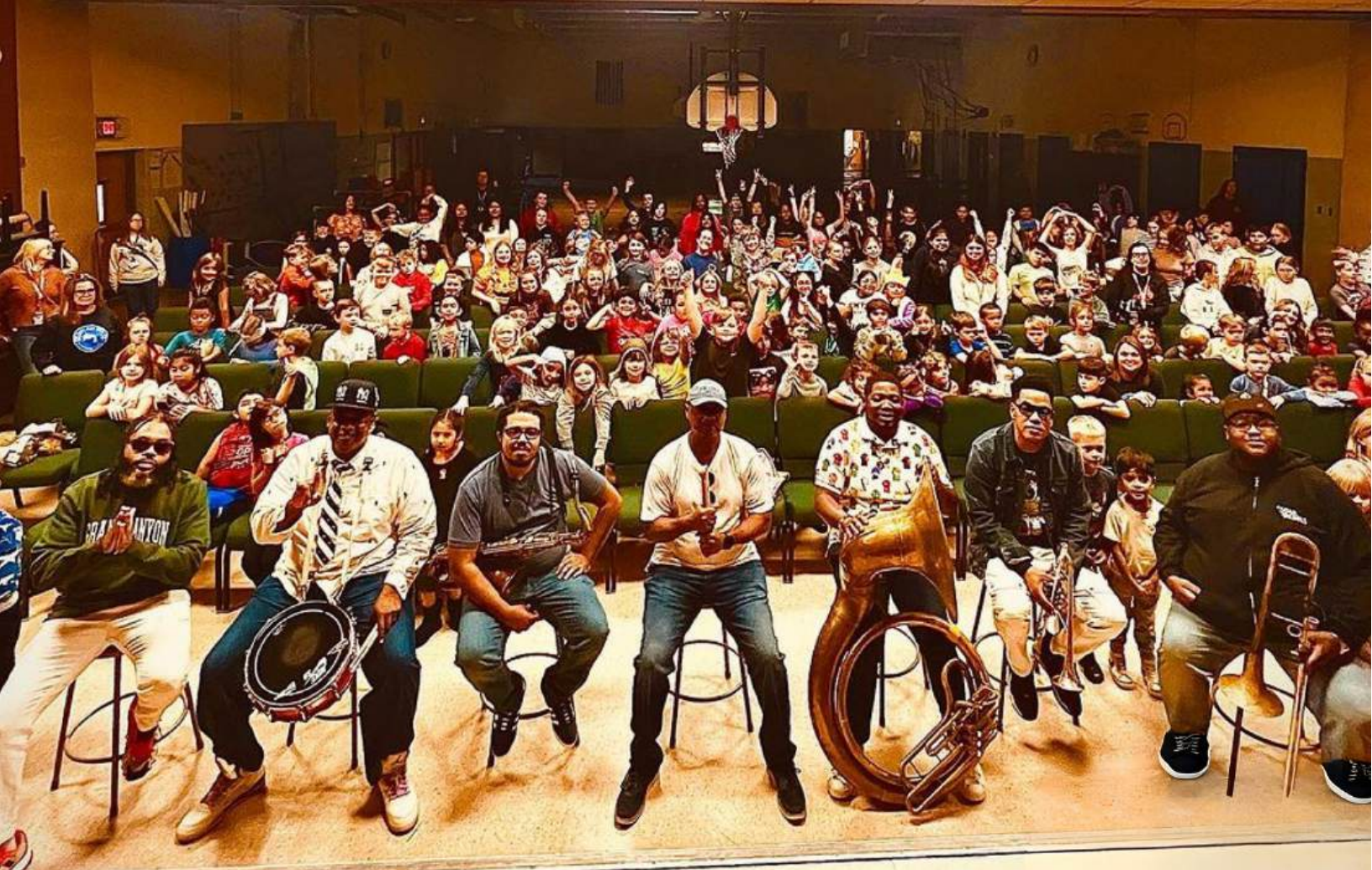
Imagen: The Soul Rebels en la Cape May Elementary School, NJ.