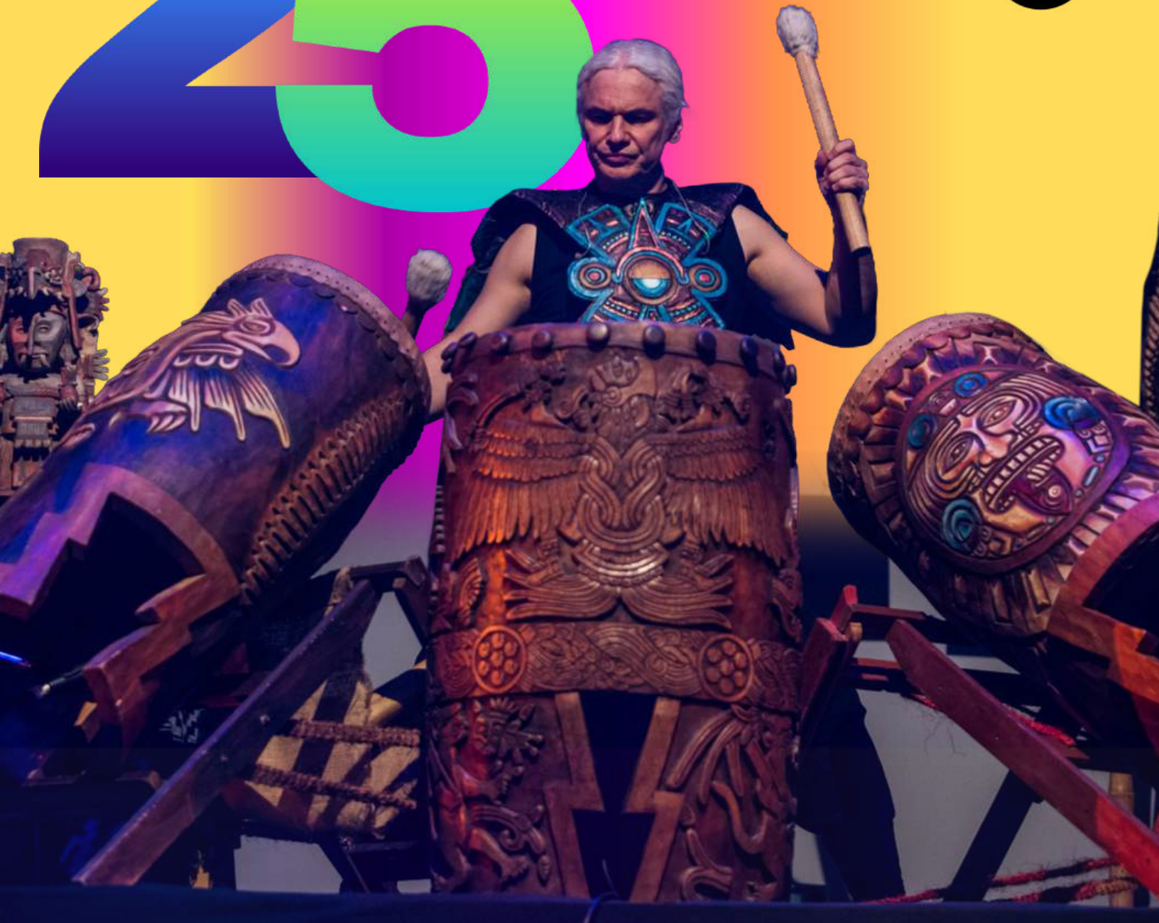
Imagen: Orquesta de Instrumentos Autóctonos y Nuevas Tecnologías.