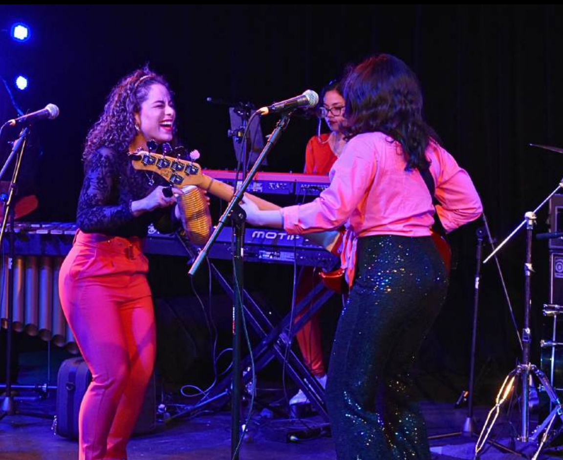
Imagen: Las Guaracheras en el Columbia Center for the Arts.

Abierto a promotores de todo el país, el Performing Arts Global Exchange PAGE es una selección anual de artistas internacionales elegidos para realizar giras por comunidades de Estados Unidos. Cada año se destaca una región con una selección de artistas de diversas disciplinas. El programa ofrece apoyo económico directo a las organizaciones sin fines de lucro que presentan a artistas de dicha selección en funciones abiertas al público y actividades comunitarias, logrando así los objetivos de intercambio y comprensión cultural.