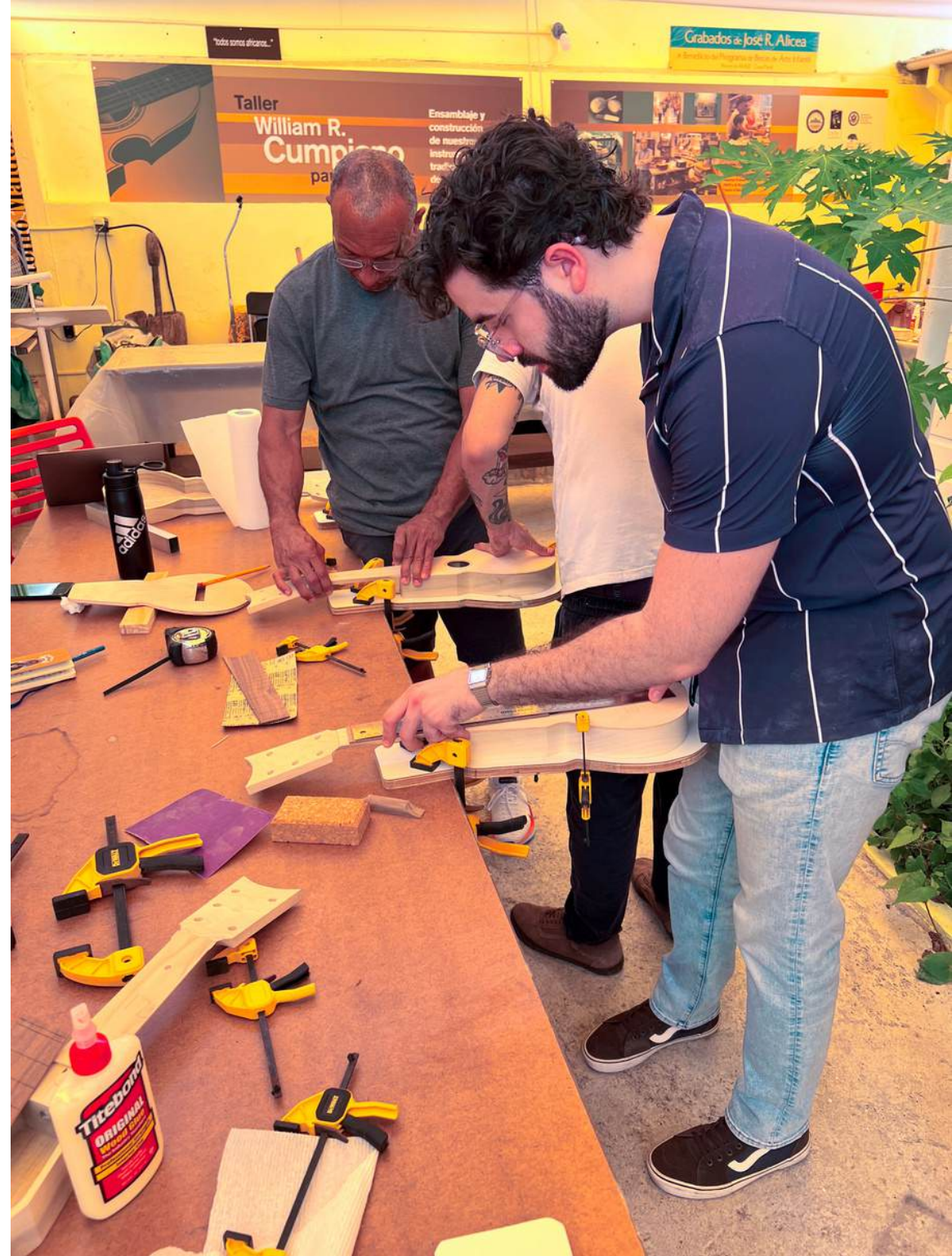
Imagen: Taller de construcción de Tiple en el Centro de Investigaciones Folklóricas de Puerto Rico, Ponce (PR).