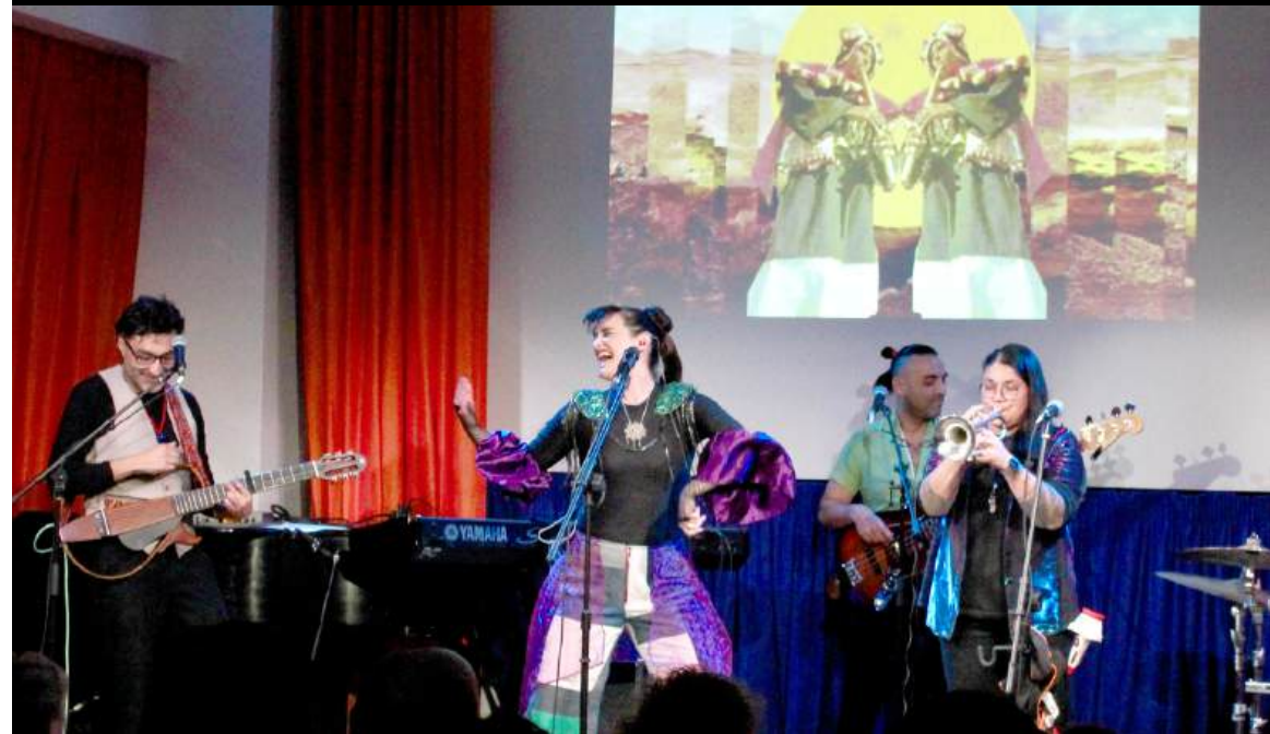
Imagen: Concierto de Pascuala Ilabaca en City of Asylum en Pittsburgh, PA.