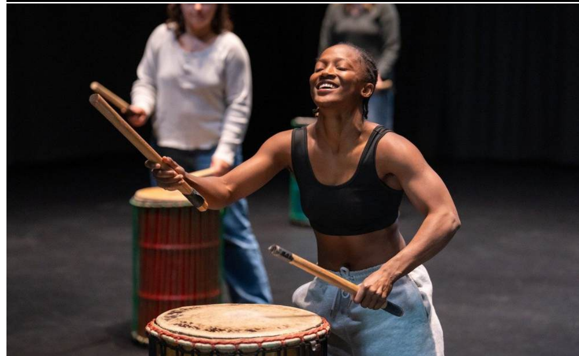
Imagen: Taller de Percusión Afro dictada por artista del Cirque Kalabante en el Moss Arts Center.