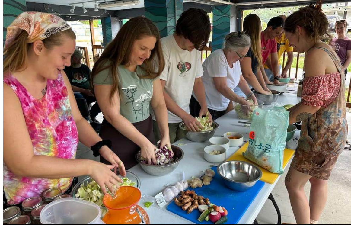
Imagen: Clase de fermentación con River House en Capon Bridge, WV.

Subvención para la Sustentabilidad Cultural: Raíces Comunitarias proporciona fondos sin restricciones para la operatividad de organizaciones artísticas fundadas por, con y para comunidades de color, permitiéndoles mantener y expandir sus actividades y beneficiando a las comunidades a las que sirven. Asimismo, apoya experiencias artísticas interculturales y fomenta una mayor colaboración entre artistas, comunidades y las Organizaciones Regionales de Artes (RAO). Subvención para la Sustentabilidad Cultural: Raíces Comunitarias es una alianza entre las seis Organizaciones Regionales de Artes de EE. UU. y la Fundación Wallace.