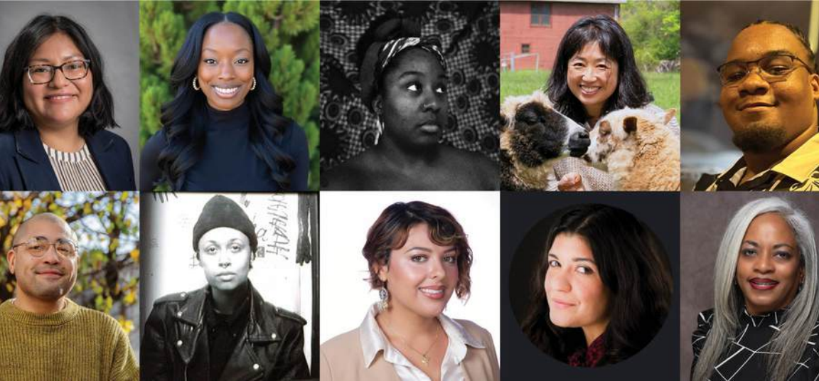
Imagen: Mid Atlantic Arts National Leaders of Color Fellows 2025.

The National Leaders of Color Fellowships es una experiencia transformadora de desarrollo de liderazgo, diseñada por WESTAF para fomentar el liderazgo multicultural en el sector creativo y cultural. Gracias a la colaboración con otras organizaciones regionales de artes de Estados Unidos, el programa se ha expandido a nivel nacional convirtiendo su misión en una iniciativa de todo el país.