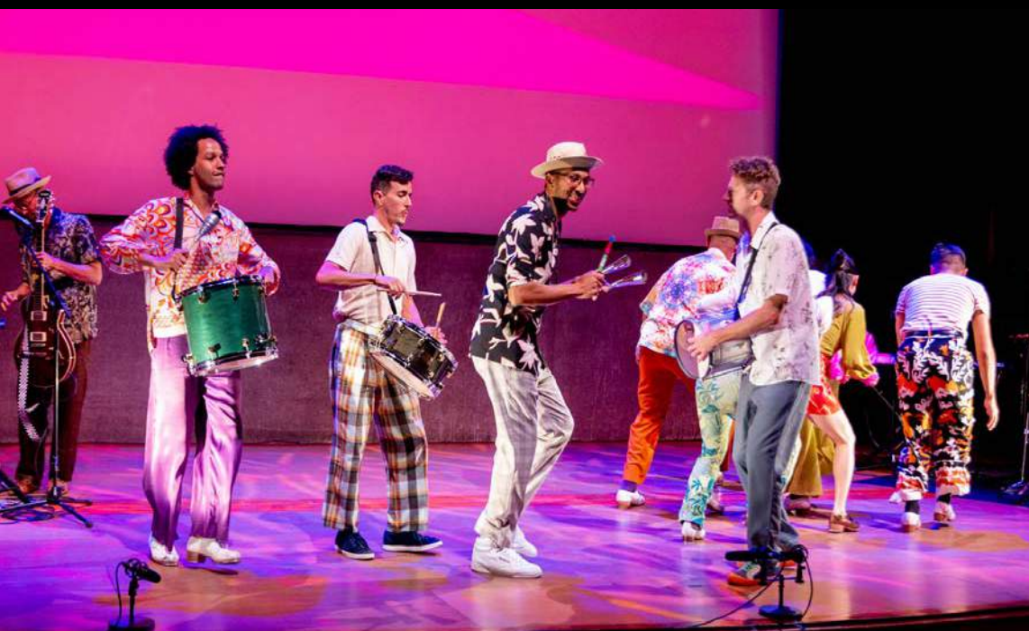
Imagen: Music From The Sole en el Museo Guggenheim de Bilbao, España.

El Special Presenter Initiatives SPI brinda oportunidades de apoyo adicional para organizaciones de pequeña y mediana escala que presentan artes escénicas en Delaware, el Distrito de Columbia, Puerto Rico, las Islas Vírgenes de los EE.UU., y Virginia Occidental. Se apoya el pago de honorarios a artistas que provengan de cualquier parte del mundo. Las actividades pueden incluir presentaciones en vivo así como también proyectos de vinculación con la comunidad local.