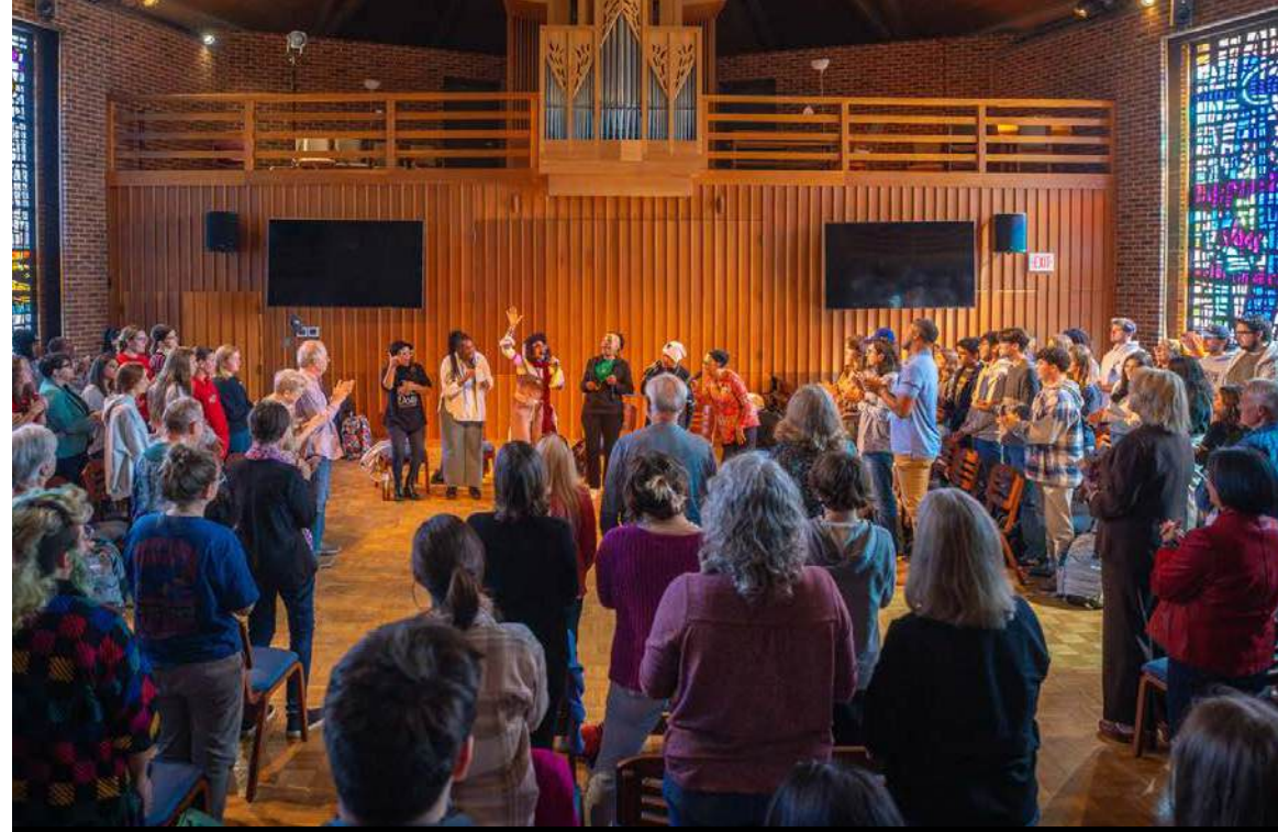
Imagen: El Legado de la Música de Protesta Americana, Universidad de Shenandoah. Capilla del Goodson—Recital Hall.

Mid Atlantic Arts ofrece regularmente Servicios de Información a artistas, organizaciones, miembros y personas interesadas a través de diversas plataformas de comunicación. Dicha información se difunde mediante boletines mensuales, correo electrónico, redes sociales y comunicados de prensa. Mid Atlantic Arts administra midatlanticarts.org , donde se encuentra toda la información detallada de los programas y las oportunidades de financiación para artistas y organizaciones.