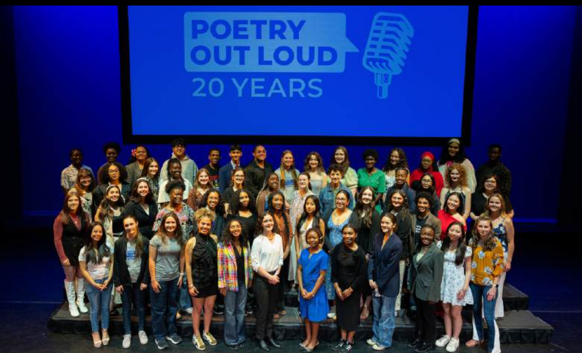
Imagen: Campeones estatales del Poetry Out Loud 2025.

Mid Atlantic estrenó el Philly Jazz Month en abril de 2025 con una programación para todas las audiencias; desde conciertos eclécticos hasta actividades especiales en las escuelas con el propósito de hacer comunidad y resaltar a los artistas de Philadelphia. Este programa anual que se realiza durante un mes entero es producido en colaboración con Creative Philadelphia.