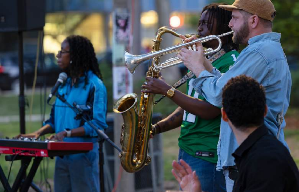
Imagen Clark Park Jazz Pop Up como parte del Philly Jazz Month 2025.