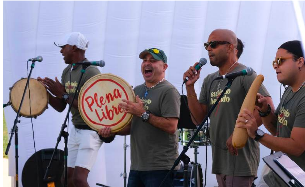
Imagen: Plena Libre en la Universidad Estatal de Frostburg.